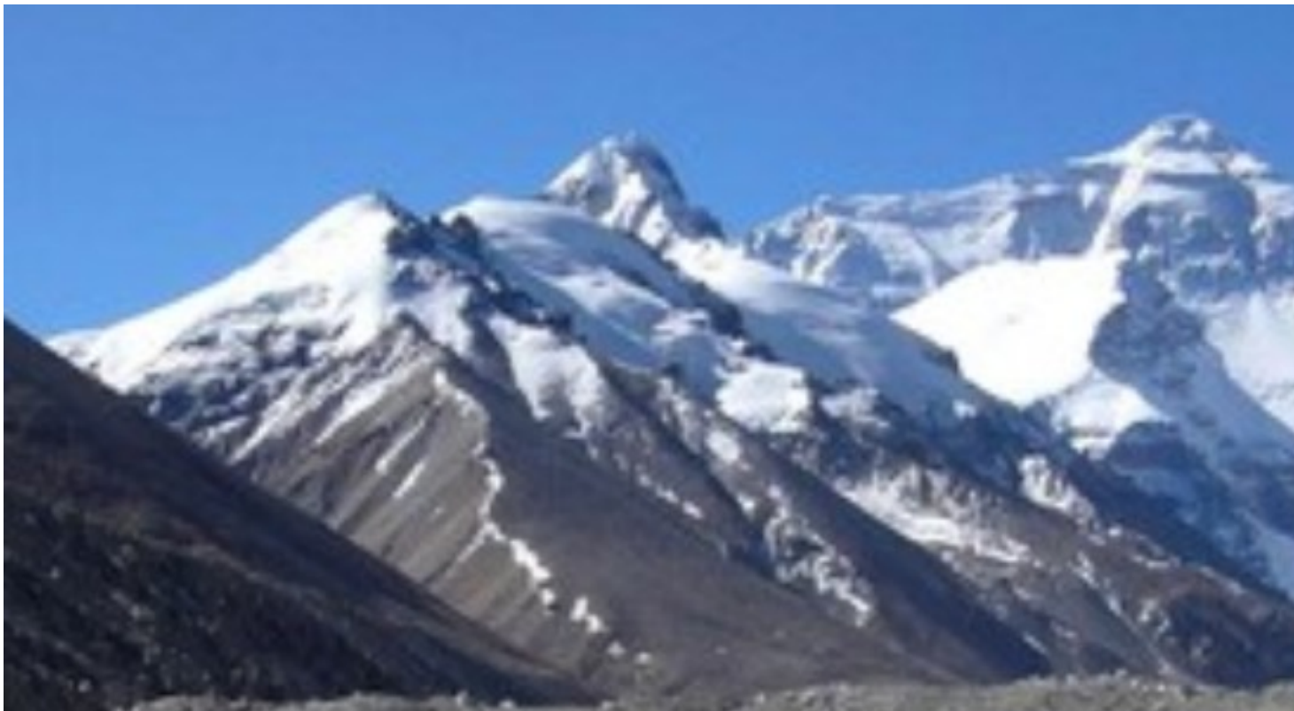
Mt. Everest od północy

Denis Urubko i Aleksiej Bolotov 20 marca wyruszyli z Moskwy do Nepalu. Pojawili się tu jako jedna z pierwszych ekip zmierzających pod Mt. Everest.