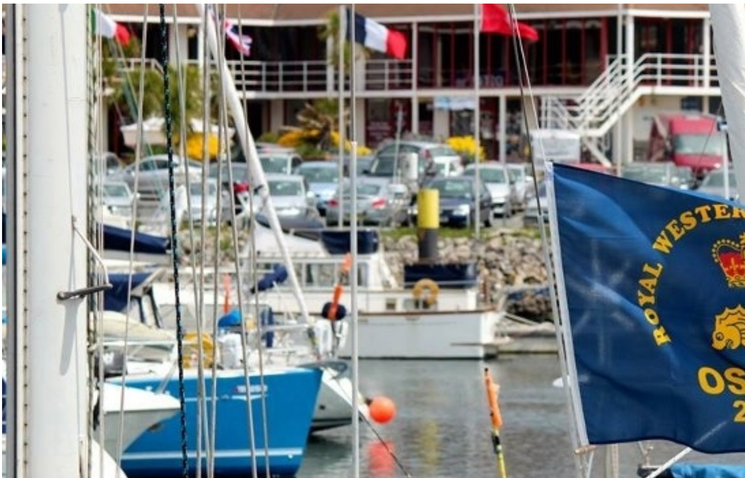
Marina w Plymouth