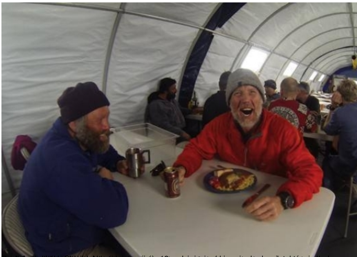
Przedstawienie w ramach projektu "Wspieranie rozwoju przedsiębiorczości w regionie" autor: Jakub Karp