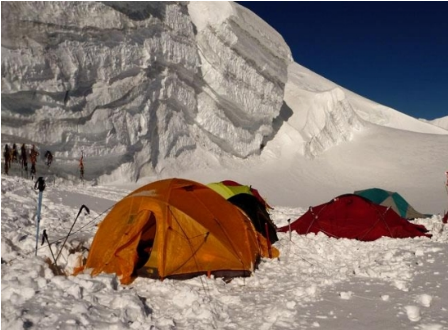
Obóz 1. na wysokości 5800 m n.p.m.