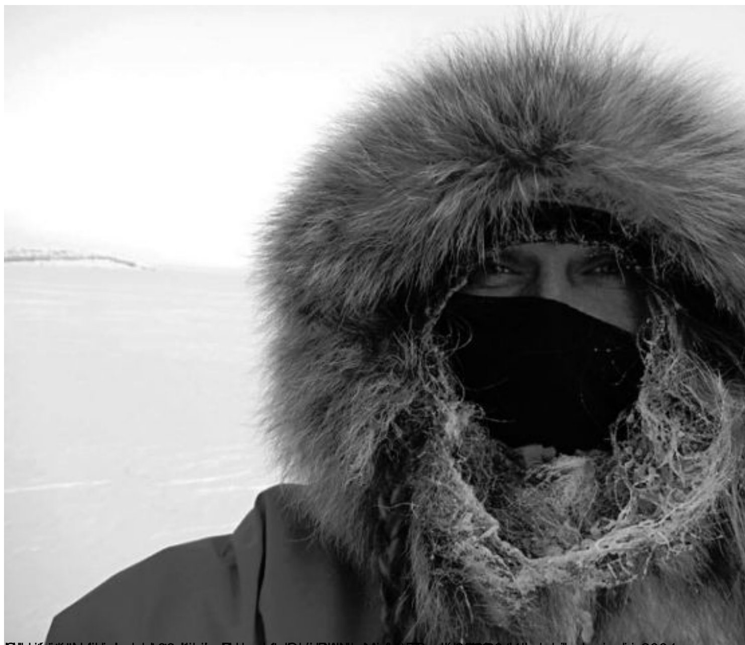
Svalbard, 23 marca 2016, godz. 16:27, foto: [nieczytelne], [nieczytelne] 2004